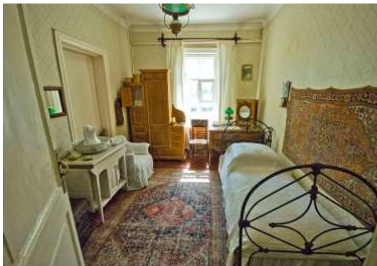
Мелихово. Комната А. П. Чехова