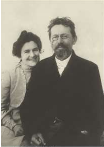
А. П. Чехов и О.Л. Книппер

«Хорошо вспомнить о таком человеке, тотчас в жизнь твою возвращается бодрость, снова входит в неё ясный смысл».