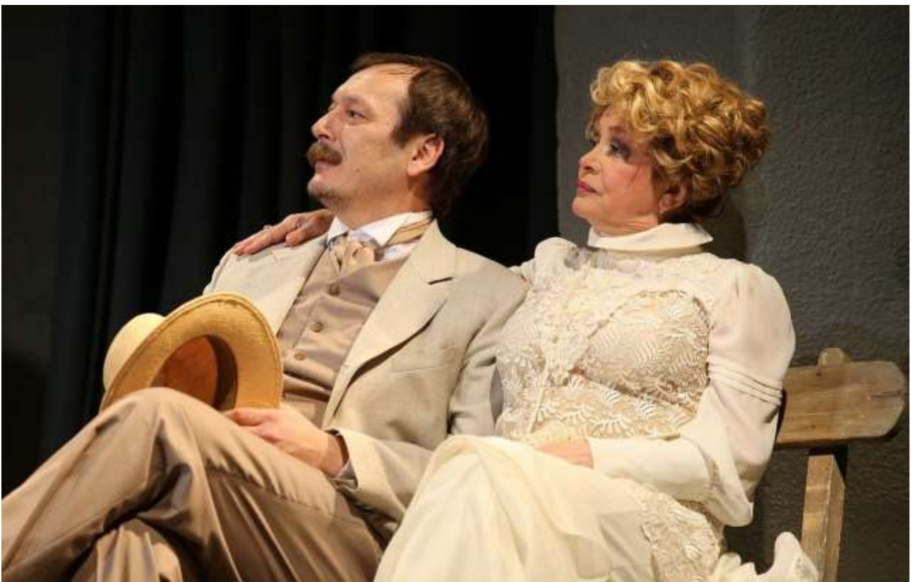
СЦЕНА ИЗ СПЕКТАКЛЯ "ВИШНЁВЫЙ САД" ПО А.П. ЧЕХОВУ

45. Чехов, А. П. Чайка: постановка МХАТа им. Горького / А. П. Чехов; пост. Б. Ливанов. - М.: Восток В, 1999. - 1 вк. (172 мин.). - (Антология русского театра: Русская классика).