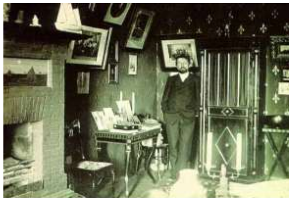
А.П. Чехов в Ялте

58. Александрина, М. "Домашний музей": [по чеховским местам теперь можно путешествовать в Интернете] / М. Александрина // Ежедневные новости. Подмосковье. – 2007. - 7 июня. – С. 2.