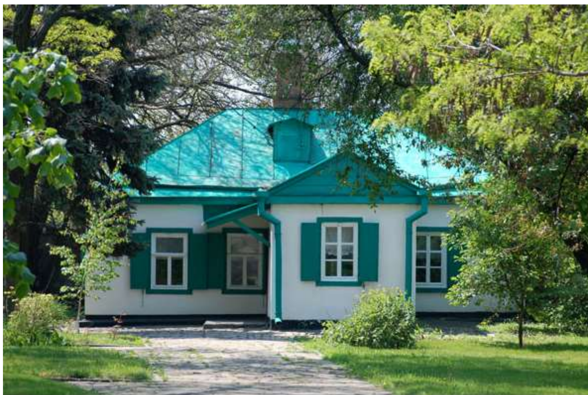
Дом Чеховых в Таганроге

314. Швейцер, М. Дальнее следование: [литературный сценарий по мотивам сочинений А.П. Чехова] / М. Швейцер, С. Милькина // Киносценарии. – 2006. - № 4. – С. 4 – 29.