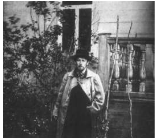
Чехов в Мелихово. 1892 г.

65. Бычков, Ю. К Чехову: [о театральных фестивалях "Мелиховская весна"] / Ю. Бычков // Москва. – 2006. - №10. – С. 202 - 204.